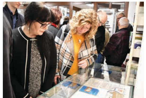
Das Interesse an der Sonderausstellung war zum Eröffnungsabend groß. Viele Besucherinnen und Besucher kamen ins Stadtarchiv.

Zur Eröffnung der Sonderausstellung am 23. Februar konnten zahlreiche Gäste im Stadtarchiv begrüßt werden. Zu ihnen gehörten unter ande-