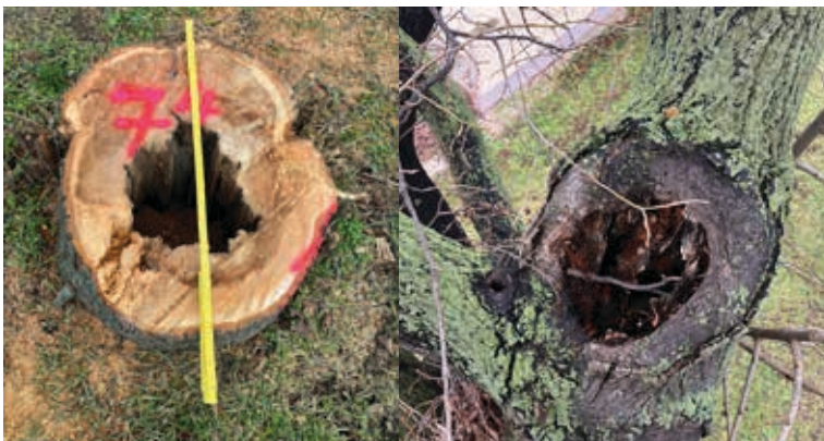
Beispiele für Schäden an Straßenbäumen

Sind Gehölze aufgrund von Trockenheit oder Krankheitsbefall nicht mehr standsicher, besteht die akute Gefahr, dass sie umstürzen oder Äste abbrechen und herunterfallen.