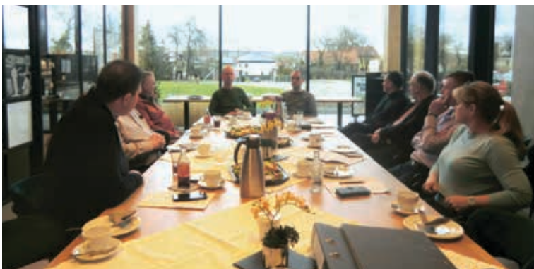
Bürgermeister und Bürgermeisterin der Mitgliedskommunen, Vertreter der Verwaltung sowie Geschäftsführer und Vorsitzender des Tourismusverbandes bei der Gesprächsrunde.

ausgearbeiteten Vorhaben mit Zeitschiene und Finanzierungsoptionen